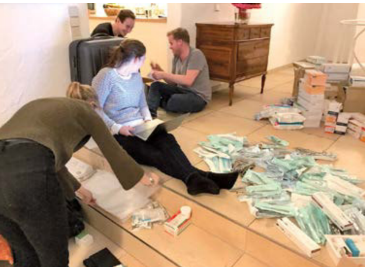
Die Spannung steigt: Die gespendeten zahnärztlichen Materialien werden reisefertig verpackt.

Unten: einer hält ab, eine „kühlt“ und einer extrahiert: Teamwork am Behandlungsstuhl auf der Sisal-Farm.