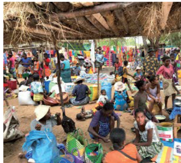
Auf Madagaskar leben etwa 25 Mio. Menschen, etwa die Hälfte von weniger als umgerechnet 1 Dollar pro Tag.